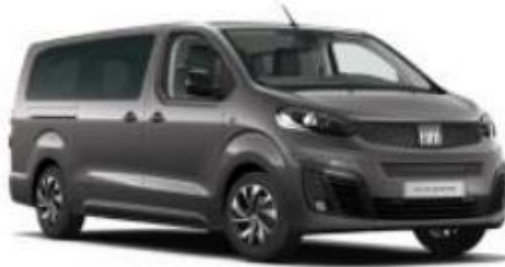
Габаритні розміри, мм

Забарвлення кузова фарбою металік темно сірого кольору 6FW (код VR-691/A Grigio scuro metallizzato)