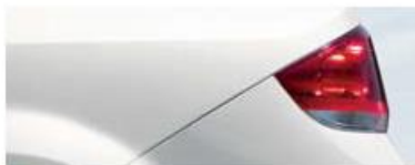
Окраска кузова пастельной краской белого цвета

Производитель или продавец оставляет за собой право изменения комплектаций и цен на автомобили без предварительного уведомления.