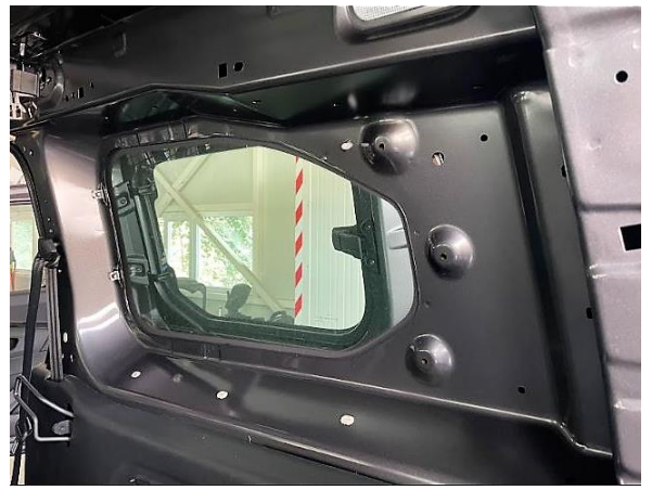
Салон та вантажне відділення