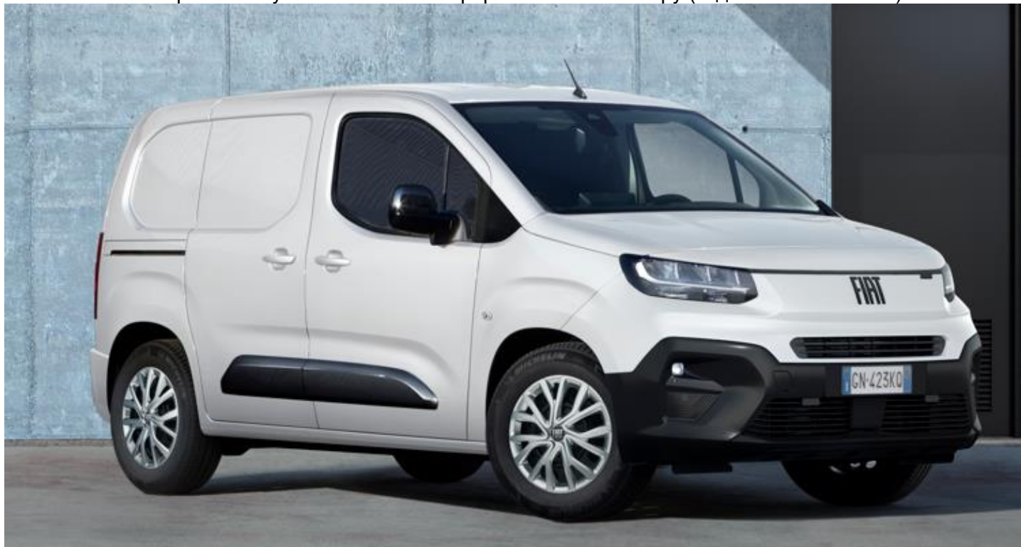
Габаритні розміри, мм

Забарвлення кузова пастельною фарбою білого кольору (код 549 - ICY WHITE)