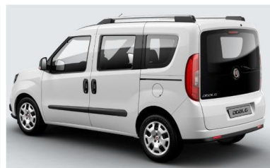
Забарвлення кузова фарбою металік (код 293)