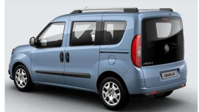
Забарвлення кузова фарбою металік (код 612)