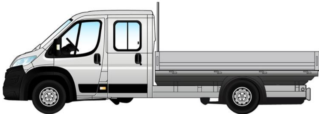
Габаритні розміри та розміри вантажного відділення, мм

Забарвлення кузова пастельною фарбою білого кольору (код 549 – DUCATO BIANCO)