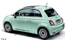
166 VERDE LATTEMENTA