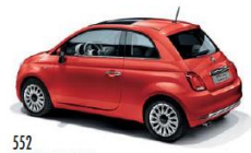
552 ROSSO CORALLO