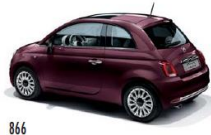
866 BORDEAUX OPERA