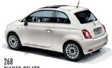
268 BIANCO GELATO