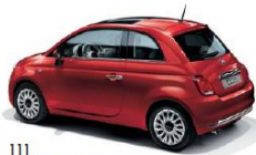
111 ROSSO PASSIONE